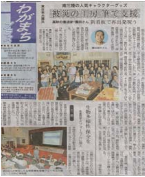
神戸新聞 (23.8.26) に掲載

東日本大震災で甚大な被害を受けた宮城県 南三陸町にある入谷公民館館長より依頼を 受けて、『入谷YES工房』看板寄贈