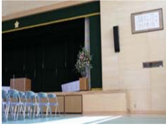
阿弥陀小学校講堂に飾られている校歌