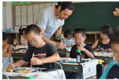
広報たかさご (23年9月号) 掲載

高砂市教育委 員会「放課後 子ども教室」 の一環で、夏 休み書道教室 講師として高 砂市内小学校 全一〇校をボ ランティアで まわる