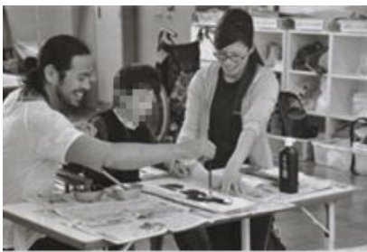
広報かこがわ (24年1月号) 掲載