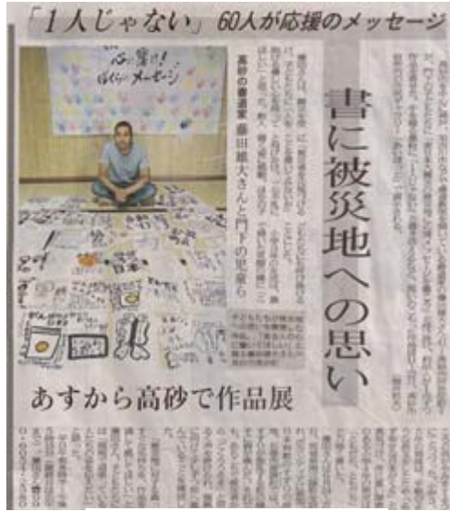
神戸新聞 (23.7.10) に掲載