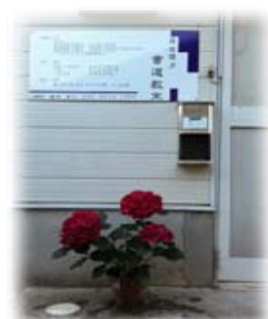
▼アトリエ前の紫陽花

(短評) 六月の課題締切りの稽古日、宿題で十二枚書いて持ってきて来て、教室でも毛筆の稽古の後に居残りをして数枚書いて、とても熱心に練習をした成果の一枚。丁寧に書けています。