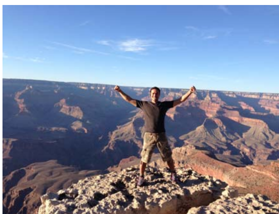
グランドキャニオンにて